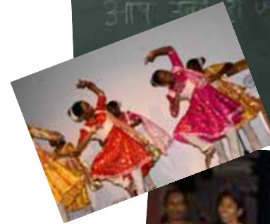
Ecde de Danse CGPLI