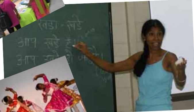
Dictée Hindi 2010