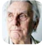
Gilles Lapouge : Ecrivain